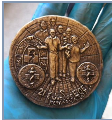
Το μετάλλιο της 21 ης Συνόδου της Επτανησιακής Οδοντιατρικής Εταιρείας

Θεατρική παράσταση για παιδιά Δημοτικού από την Εταιρεία Μουσικών Θεατρικών Παραγωγών «Apple Productions» με εκπαιδευτικό περιεχόμενο και στόχο την ευαισθητοποίηση των παιδιών στην στοματική υγιεινή. Παραστάσεις πρωινές, στα πλαίσια του σχολικού προγράμματος, δωρεάν για τα παιδιά, 1 στην Ιθάκη και 2 στην Κεφαλονιά, σε χρόνο που θα ανακοινωθεί προσεχώς. (Η εκδήλωση αυτή πραγματοποιείται με τη συνεργασία της Περιφέρειας Ιονίων Νήσων και του Δήμου Αργοστολίου)